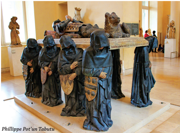
Phillippe Pot'un Tabutu