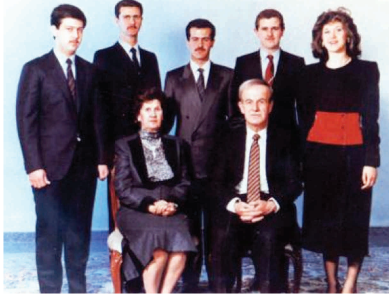
Aslan ailesi (!)...Oturan, baba Hafız (Koruyucu) Esad (Aslan) ve eşi Anisa Makhlouf. Arka sırada ayakta Aslanlar (!); soldan sağa: Mahir (Yetenekli Aslan), Beşar (Haberci Aslan), Basil (Kral Aslan), Macid (Şanlı, Şöhretli Aslan) ve Buşra (Müjdecî Aslan)...